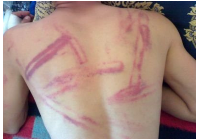
Secuelas físicas de la represión de las manifestaciones de mayo de 2008 en Marrakech.